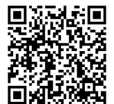
町 HP「世代間交流事業」

参加するときは、決められたルールを守って参加してください。 参加にあたり、右記のQRコードより、町ホームページ内にある 「注意事項及び安全マニュアル」のご確認をお願いします。 参加をキャンセルする場合についても記載してあります。