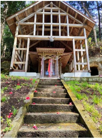
薬師堂 ※中に磨崖仏が安置