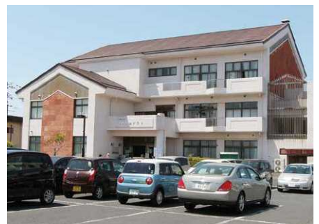
▲接種会場 旧利府町公民館