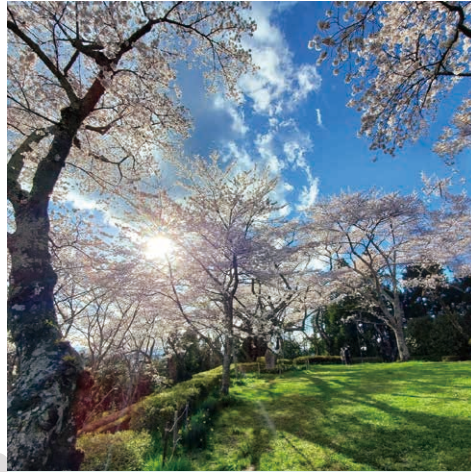
2 館山公園 投稿者: @oishigohansendai 投稿日: 2021/4/13