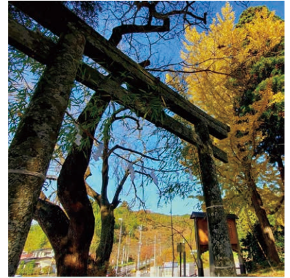
3 染殿神社 投稿日: 2021/11/16