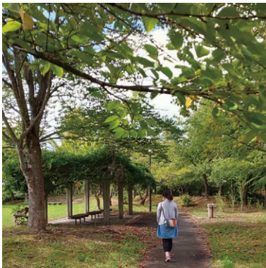
4 しらかし台 いこいの広場 投稿者: @chibihana41 投稿日: 2021/9/29