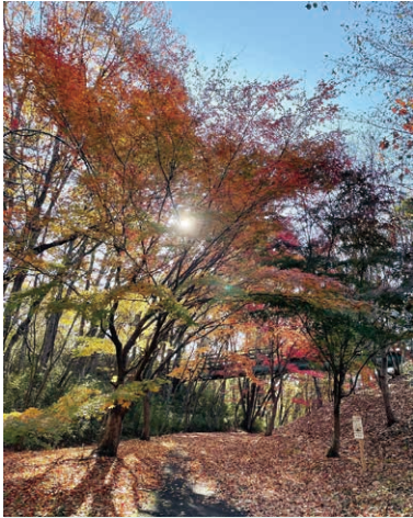
1 青山 森の里公園 投稿者: @saori_0417 投稿日: 2021/11/20