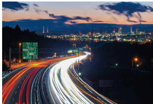
7 森郷 三陸自動車道 投稿者: @coolgalileo2001 投稿日: 2021/12/13