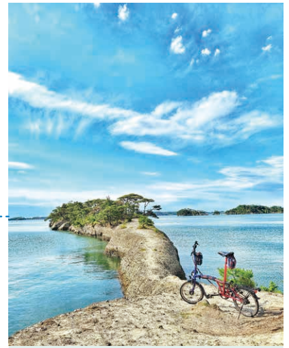
5 表松島 馬の背 投稿者: @kubo.shin 投稿日: 2021/5/31