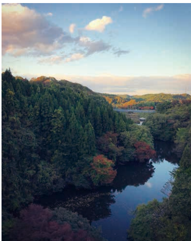
6 菅谷台 グランディ21 投稿者: @pon_try8 投稿日: 2021/10/28