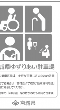
〈対象区画であることを示すステッカー〉