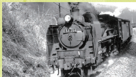
▲山線を走ったC58形蒸気機関車

旧東北本線の築堤下に造られた外壁、内壁ともにレンガ造の橋梁。二級河川藤田川に架けられ、側面を垂直にしたアーチ形断面を持つ。