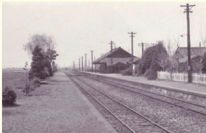
電化前の東北本線利府駅のホーム(1960年頃)