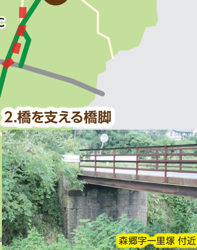
森郷字一里塚 付近