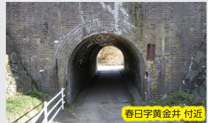
春日字黄金井 付近

明治時代に造られたレンガ造りのアーチ橋。山線が走っていた頃の様子を伝えてくれます。