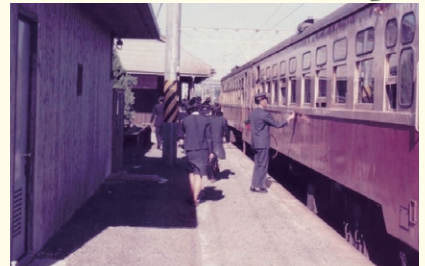
ホームから改札に向かう人々(1982年)