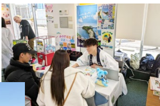
移住イベントの相談対応風景

※4.. 愛犬と飼い主がペアで山道や林道を走ったり歩いたりしながら自然を満喫するアクティビティ。