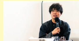
▲こ・あきないの学校(2025)