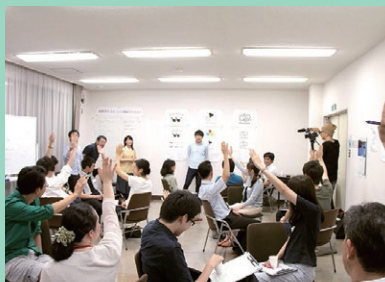
▲2016年11月開館に向けて、若者中心の住民参加型ワークショップが8回開催され、tsumikiのロゴマーク、名称などが決まった。

開館から10年 2016年11月19日、JR利府駅前に「利府町まち・ひと・しごと創造ステーション tsumiki」がオープン。学生、地域住民、行政、事業者などが協力し、自由な使い方ができる場所として誕生しました。そして、今年で開館から10年。これまでに約4万4千人の方にご利用いただき、tsumikiは地域交流、学び、起業支援、まちづくりの拠点として、多くの人に親しまれる場所となりました。現在も、コワーキング、カフェ利用、イベント開催、起業相談、学生活動、地域交流など多様な活動が行われています。これからも、「積み木」のように人やアイデアをつなぎながら、新しい挑戦を生み出し、支えていきます。