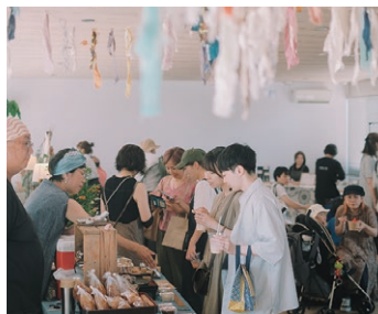
▲出店者は、「こ・あきない市」参加の経験と実績をいかして生業につなげています

「店舗を持つのはハードルが高い」と感じる方に向けて、気軽にチャレンジできる場を提供したいという想いからスタートしました。出店者は、自身がつくる雑貨・洋服・食品などのオリジナル商品を販売し、新しい仕事づくりの第一歩を踏み出しています。