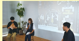
▲こ・あきないの学校(2024)