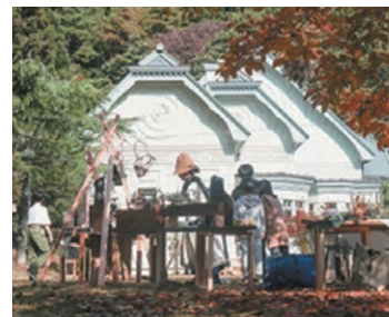
▲森のこ・あきない市 毎年秋にはtsumikiを飛び出し、宮城県民の森 青少年の森で開催しています