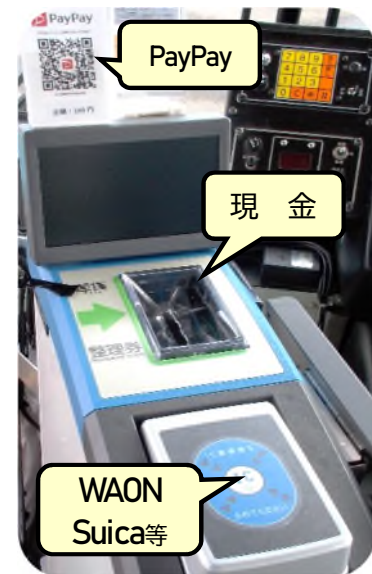
降りる時は前のドア

車内のバーコードを読み取り、運賃（160円）を入力します。乗務員に画面を提示し、運賃が正しい事を確認してもらい、支払います。