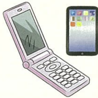
携帯電話、公衆用PHS端末 ラジオ