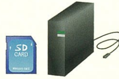
ハードディスク、USBメモリ、 メモリーカード