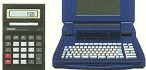
事務用電気機械器具