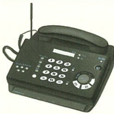
電話機、ファクシミリ