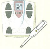
計量、測定用 機械器具