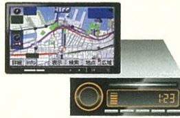
カーナビ、カーオーディオ