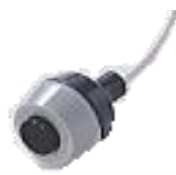
リモートスイッチ