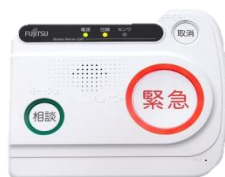
緊急通報装置本体