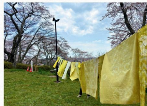
刈安染めの限定販売は12日のみ