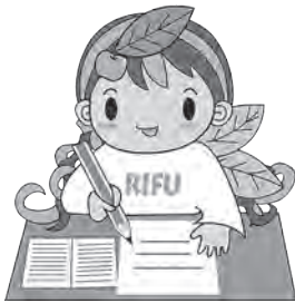
十符の里の妖精 リーフ ちゃん 利府町公式キャラクター