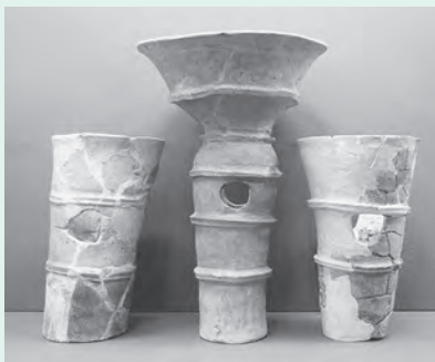
■朝顔形埴輪・円筒埴輪