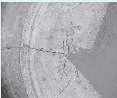
■「宮城郡」と刻まれた須恵器