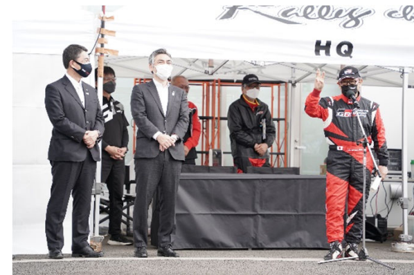
豊田章男会長が「モリゾウ」としてラリー参戦!