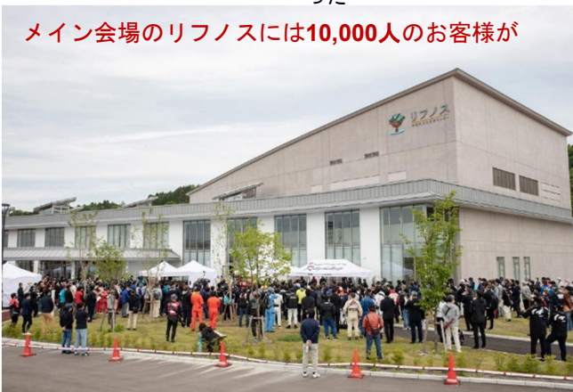
メイン会場のリフノスには10,000人のお客様が