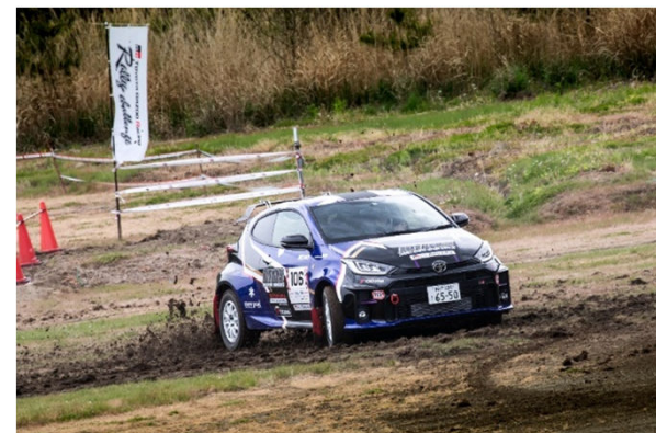
葉山のギャラリーステージでは土煙とともに大きな歓声が沸きあがった