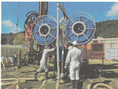
地中熱交換器設置工事