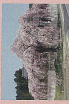
「春日の桜」 樹齢約200年(推定) ベニシダレザクラ